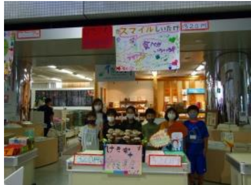
会社名：スマイルしいたけ