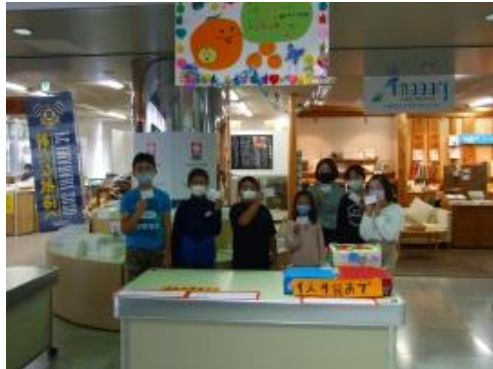
会社名：orange princess company