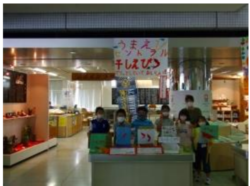
会社名：うまえびセントラル