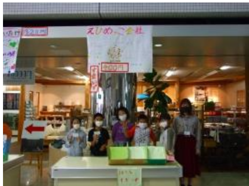
会社名：えひめっこ会社