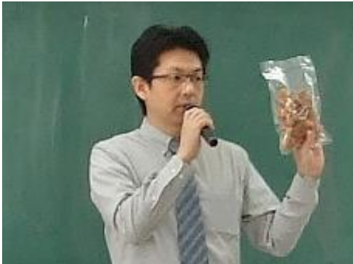
アイシス株式会社 商品：野ボール焼