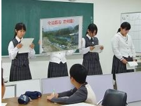
愛媛県立今治南高等学校 園芸クリエイト科 商品：みかん