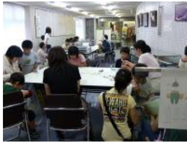
フェスタお楽しみ抽選会