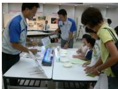
「身のまわりのもので電池を作ろう」 ～四国電力(株)～