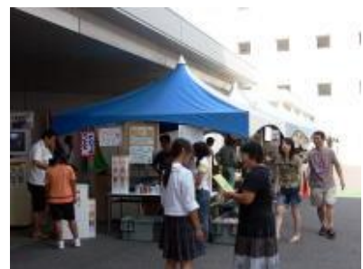
Venture Shop (ベンチャー・ショップ)