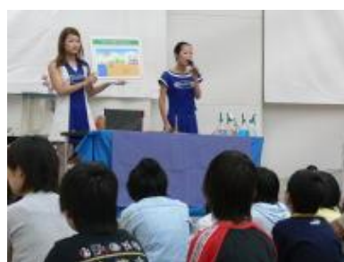
「昆虫の標本を作ってみよう」 愛媛大学サテライトスクール ～あなたも豆博士だ～