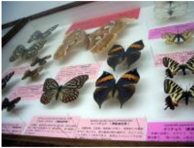
愛媛大学・サテライト昆虫展