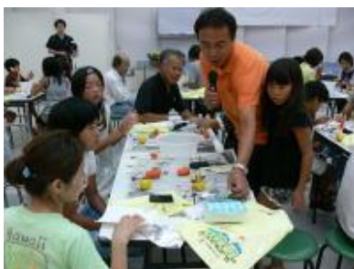
「マイナス196℃の世界」 ～四国ガス(株)～